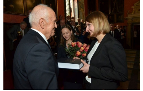
fot. Anna Wojnar