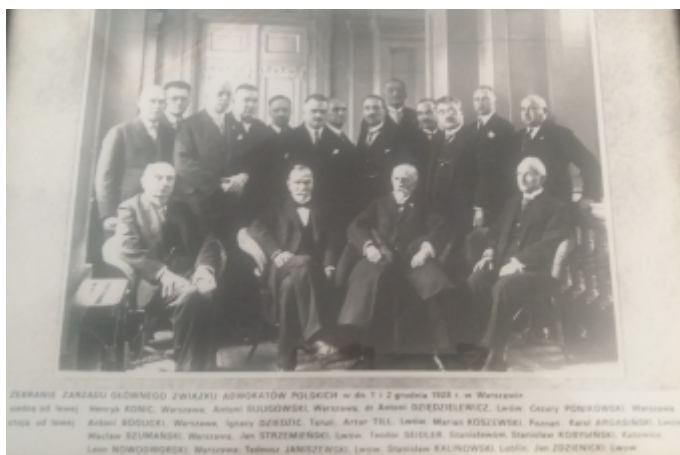
Zebranie Zarządu Głównego ZAP, 1-2 grudnia 1928 r. Warszawa