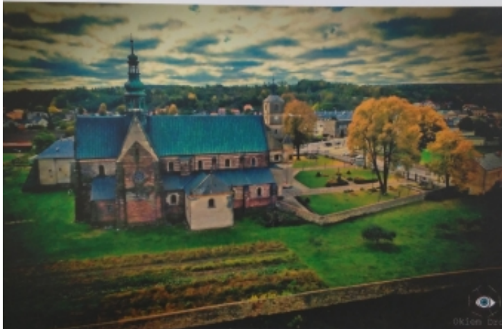
Opactwo cystersów w Wąchocku

SMO ŚWIĘTOKRZYSKIEJ IZBY ADWOKACKIEJ W KIELCACH