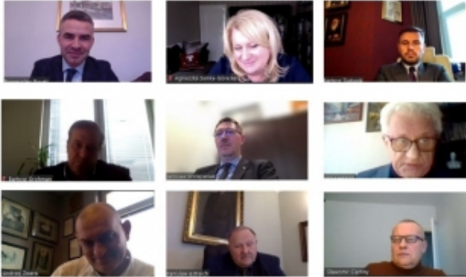
Posiedzenie Prezydium NRA