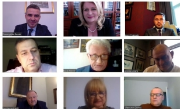
Posiedzenie Prezydium NRA