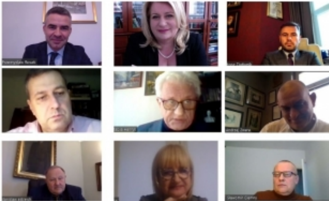
Posiedzenie Prezydium NRA