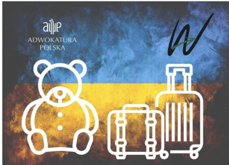
Adwokaci dzieciom uchodźców