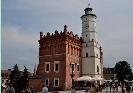
XIV-wieczny gotycki ratusz miejski w Świdonierzu, przekształcony i wzbogacony w okresie późniejszym o trójpiętrową wieżę oraz wieżę

PISMO ŚWIĘTOKRZYSKIEJ IZBY ADWOKACKIEJ W KIELCACH