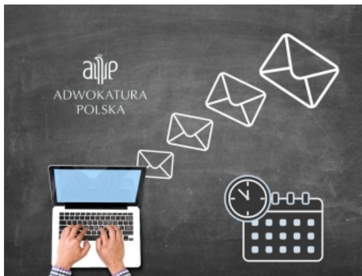
Obowiązek posiadania adresu do e-doręczeń przełożony

Więcej informacji o doręczeniach elektronicznych można znaleźć na stronach rządowych: https://www.gov.pl/web/e-doreczenia