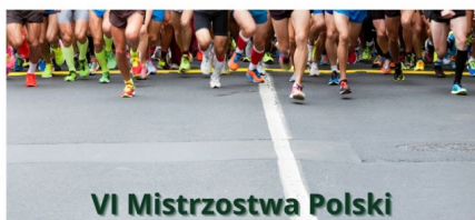
VI Mistrzostwa Polski Adwokatów w Półmaratonie Zielona Góra 2022 r. odwołane

VI Mistrzostwa Polski Adwokatów w Półmaratonie - Zielona Góra 2022 r. nie odbędą się.