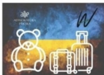
Adwokaci dzieciom uchodźców