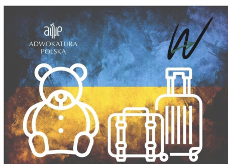
Adwokaci dzieciom uchodźców