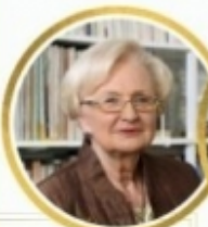
prof. dr hab. Ewa Łętowska