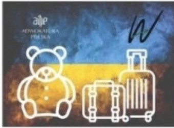
Adwokaci dzieciom uchodźców