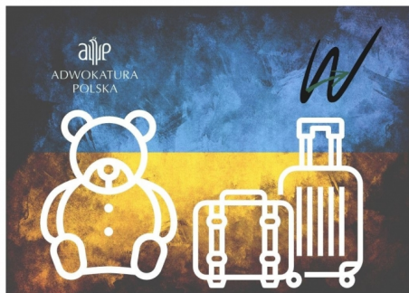
Adwokaci dzieciom uchodźców