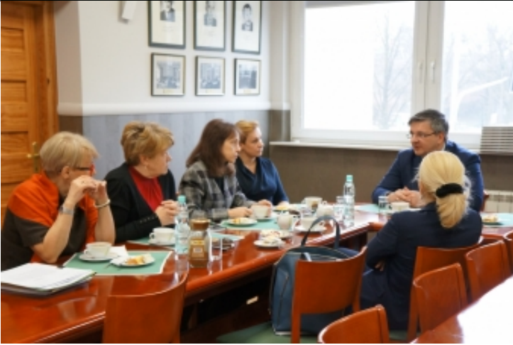
Spotkanie referatu skarg Naczelnej Rady Adwokackiej